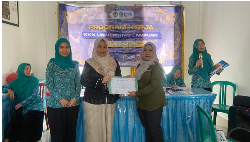
Gambar 3 Foto dengan Narasumber

Adapun evaluasi dalam kegiatan ini menggunakan pre-test dan post-test. Hasil grafik menunjukkan adanya peningkatan pemahaman peserta setelah mengikuti kegiatan "WANITA BERDAYA: Workshop Edukasi Hak Perempuan dan Anak untuk Mendukung SDGs 5 dan 16 di Kelurahan Tanjung Agung Kecamatan Tanjung Karang Timur." Berdasarkan hasil evaluasi, nilai rata-rata pretest peserta sebesar 65%, yang menunjukkan bahwa sebelum kegiatan dilaksanakan sebagian peserta masih memiliki pemahaman yang terbatas mengenai hak-hak perempuan dan anak. Hal ini mencerminkan masih perlunya upaya edukasi kepada masyarakat terkait pentingnya perlindungan perempuan dan anak serta kesetaraan gender dalam kehidupan sosial.