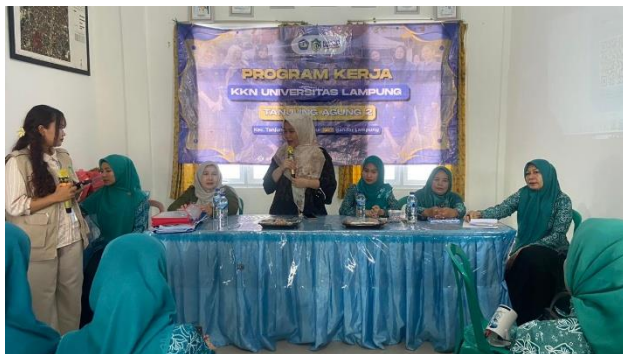
Gambar 1 Penyampaian Materi

Melalui workshop yang menghadirkan narasumber dari Dinas Pemberdayaan Perempuan dan Perlindungan Anak (PPPA) Provinsi Lampung, kegiatan ini berupaya memberikan edukasi yang terstruktur, akurat, dan mudah dipahami oleh masyarakat.