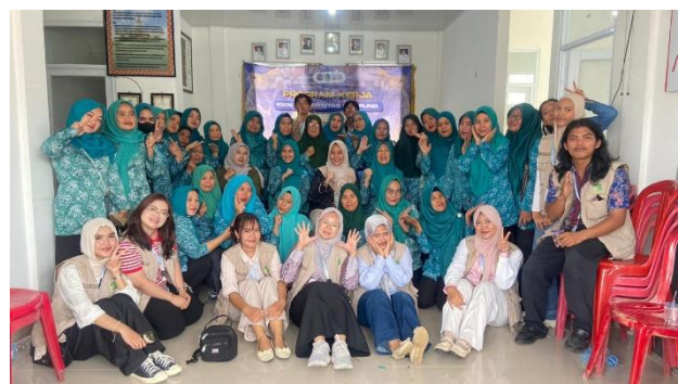
Gambar 2 Foto Bersama

Metode penyampaian materi yang interaktif melalui presentasi, diskusi terbuka, serta sesi tanya jawab memungkinkan peserta untuk terlibat aktif sekaligus memperdalam pemahaman terkait hak-hak dasar perempuan dan anak, bentuk-bentuk kekerasan, serta mekanisme hukum yang dapat ditempuh. Selain itu, pembagian gantungan kunci berisi hotline Dinas PPPA Provinsi Lampung menjadi sarana praktis agar akses informasi bantuan selalu tersedia.