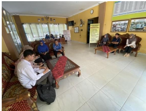
Gambar 5 Pertemuan koordinasi antara tim PkM dengan guru SMKN 7 Bandar Lampung

Pada tahap inti yaitu pelatihan pada gambar difokuskan pada interaksi edukatif antara pemateri dan peserta. Gambar 8 (a) menunjukkan proses penyampaian materi teoretis di awal sesi yang kemudian diikuti dengan sesi praktik mandiri. Pada saat pelatihan peserta berhasil melakukan instalasi proyek menggunakan perintah npx create-next-app , yang merupakan indikator keberhasilan awal dalam teknis operasional. Tim PkM pendampingan one-on-one saat siswa mengalami kendala pada struktur folder atau routing.