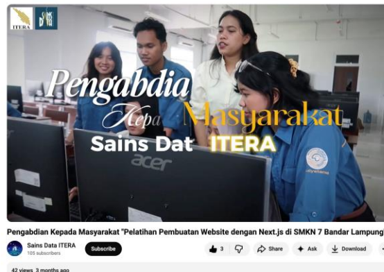
Gambar 4 Dokumentasi video rangkaian kegiatan pelatihan Next.js di SMKN 7 Bandar Lampung

Sebagai tindak lanjut untuk memperkuat kompetensi teknis, dilaksanakan sesi khusus mengenai deployment aplikasi di Laboratorium Prodi Sains Data ITERA pada tanggal 22 November 2025. Kegiatan ini diakhiri dengan showcase proyek aplikasi web dinamis yang dikembangkan secara berkelompok oleh siswa. Semua rangkaian kegiatan dibuat dalam bentuk video yang tersedia pada akun youtube Prodi Sains Data Institut Teknologi Sumatera ( https://youtu.be/8QynfUF3B9w?si=9jKJwew5nsdNaRvI ) ditunjukkan pada gambar 4.