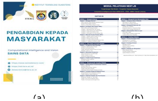
Gambar 2. Modul pelatihan Next.js bagi siswa SMKN 7 Bandar Lampung meliputi (a) sampul modul dan (b) outline pelatihan

Pelatihan inti dilaksanakan selama dua hari, yaitu pada tanggal 13-14 Oktober 2025, bertempat di laboratorium RPL SMKN 7 Bandar Lampung. Dalam sesi ini, siswa diberikan materi dasar mengenai framework Next.js, pembuatan proyek, hingga struktur folder. Hasil kegiatan telah termuat pada website ITERA ( https://www.itera.ac.id/perkuat-kompetensi-siswa-prodi-sains-data-itera-latih-pembuatan-website/ ) yang ditunjukkan pada gambar 3.