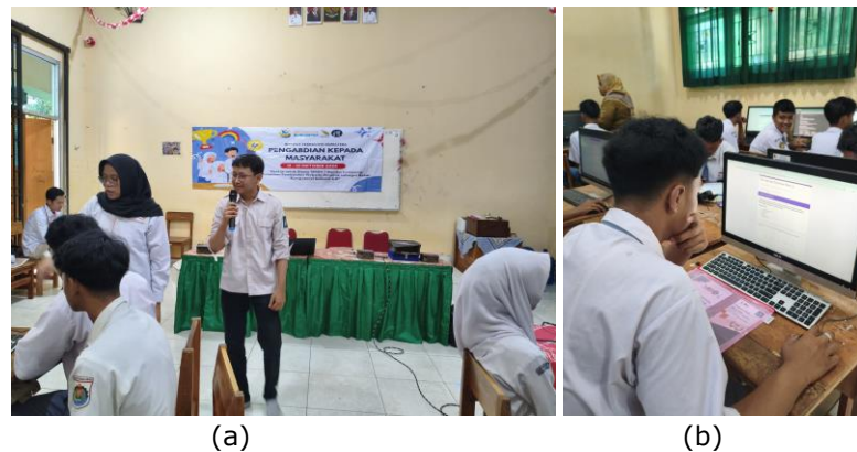
Gambar 6 Rangkaian kegiatan pelatihan (a) penyampaian materi dan (b) pengisian instrumen post-test

Pada tahap akhir yaitu monitoring dan evaluasi mencakup pengisian instrumen post-test oleh para siswa ditunjukkan pada gambar 8 (b). Foto-foto kegiatan menunjukkan antusiasme dan fokus peserta dalam merefleksikan kembali materi yang telah diterima. Dokumentasi ini menjadi bukti autentik bahwa data yang diolah dalam analisis statistik inferensia (Uji Wilcoxon) diambil langsung dari responden dalam kondisi lingkungan belajar yang terkendali. Secara keseluruhan, dokumentasi kegiatan menunjukkan bahwa pelatihan berjalan sesuai dengan roadmap yang telah direncanakan.