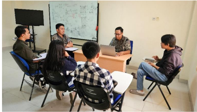
Gambar 6. Persiapan Tim PKM

Tahapan pelaksanaan dimulai dengan persiapan tim PKM secara internal. Persiapan dilakukan dengan membahas hal-hal teknis dan administratif terkait kegiatan PKM yang akan dilakukan bersama mitra, mengkoordinasikan peran dan fungsi setiap bagian tim PKM meliputi peran dosen teknik sipil, sistem informasi dan teknik lingkungan serta peran mahasiswa dalam pelaksanaan PKM.