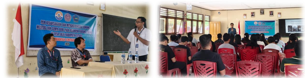
Gambar 7. Sosialisasi Kesiapsiagaan dan Mitigasi Bencana

Tahapan pelaksanaan dimulai dengan persiapan tim PKM secara internal. Persiapan dilakukan dengan membahas hal-hal teknis dan administratif terkait kegiatan PKM yang akan dilakukan bersama mitra, mengkoordinasikan peran dan fungsi setiap bagian tim PKM meliputi peran dosen teknik sipil, sistem informasi dan teknik lingkungan serta peran mahasiswa dalam pelaksanaan PKM.