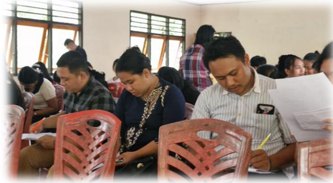
Gambar 9. Monitoring Evaluasi