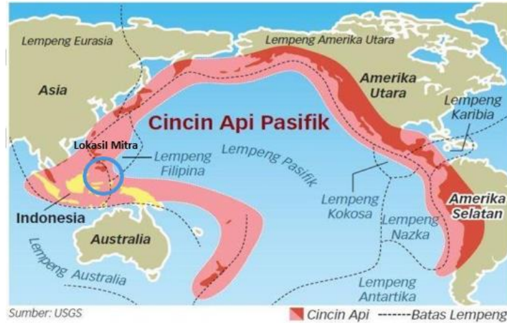
Gambar 1. Kawasan Cincin Pasifik

Desa Salili Kabupaten Sitaro berada di kawasan cincin api Pasifik tepatnya pada lereng barat daya Gunung Karangetang, yang merupakan salah satu gunung berapi paling aktif di Indonesia. Desa Salili berjarak sangat dekat \pm 4,59 km dari gunung berapi sehingga rentan terhadap bencana alam, terutama gunung meletus dan gempa bumi.