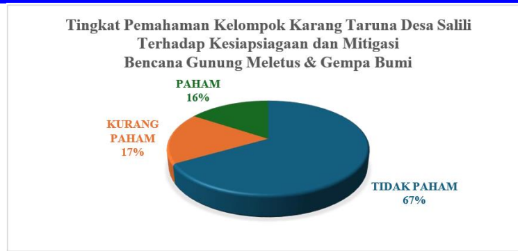
Gambar 3. Data Analisis Tingkat Pemahaman Kelompok Karang Taruna Desa Salili

Data analisis Kelompok Karang Taruna Desa Salili disimpulkan sebanyak 67% tidak memahami dan 17% kurang memahami kesiapsiagaan dan mitigasi bencana. Hanya sebanyak 16% memahami kesiapsiagaan dan mitigasi bencana. Aspek-aspek tingkat pemahaman yang dimaksud meliputi pemahaman terhadap titik kumpul dan jalur evakuasi saat bencana, bagaimana partisipasi kelompok dan respon evakuasi saat bencana.