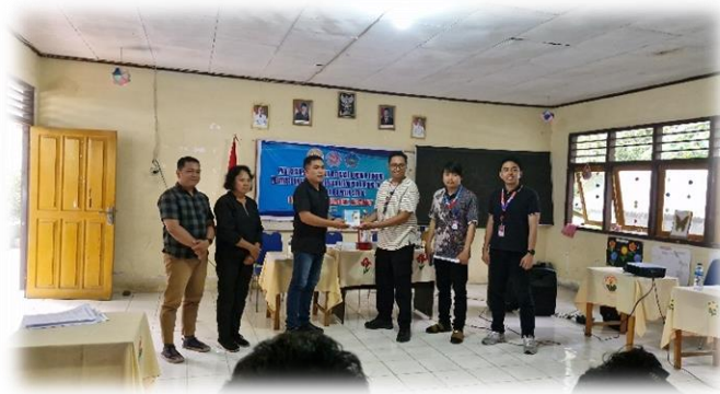
Gambar 10. Simbolis Penyerahan Alat Dasar Keselamatan

Pada tahap ini, dilakukan pengisian kuesioner oleh peserta dari kelompok Karang Taruna Desa Salili sebelum dan sesudah pelaksanaan kegiatan PKM. Monitoring evaluasi ini bertujuan untuk mengukur tingkat pengetahuan, sikap, dan keterampilan peserta terhadap kesiapsiagaan dan mitigasi bencana. Proses ini dilakukan secara mandiri dengan pendampingan tim PKM agar responden memahami setiap pertanyaan yang diajukan. Hasil kuesioner digunakan sebagai dasar evaluasi kuantitatif efektivitas kegiatan. Berdasarkan hasil pre-test dan post-test, terjadi peningkatan signifikan dalam pemahaman masyarakat, yang menunjukkan keberhasilan metode pembelajaran berbasis partisipasi dan penerapan teknologi dalam memperkuat kapasitas kesiapsiagaan bencana tingkat desa.