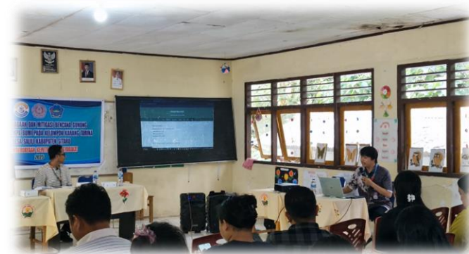
Gambar 8. Pelatihan Sistem Informasi Bencana Berbasis Web

Sosialisasi diawali dengan pemberian arahan dari Ketua tim PKM terkait maksud dan tujuan kegiatan untuk meningkatkan kesadaran siapsiaga dan mitigasi bencana gunung meletus dan gempa bumi pada Karang Taruna. Kemudian dilakukan pre-test untuk mengukur tingkat pengetahuan peserta sebelum diberikan sosialisasi. PKM dilanjutkan dengan pemaparan materi sosialisasi kesiapsiagaan dan mitigasi bencana disertai video edukatif dan informatif bagi peserta yang hadir.