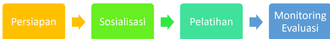
Gambar 4. Tahapan Pelaksanaan PKM

Tahapan pelaksanaan PKM dilakukan secara sistematis melalui lima tahap utama sebagai berikut: