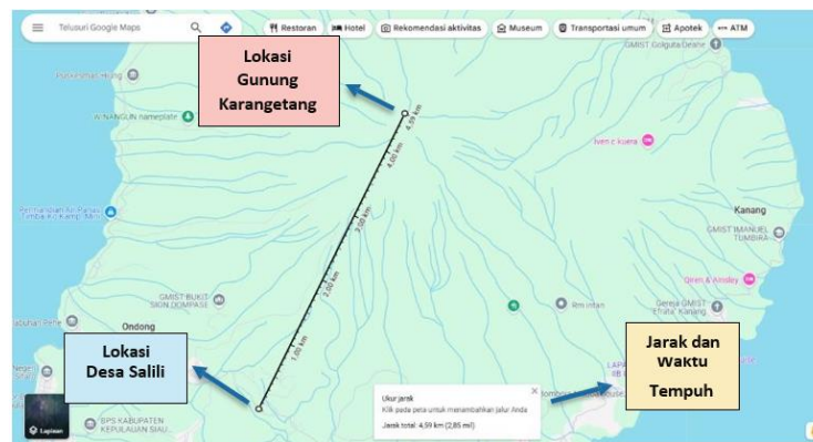
Gambar 2. Jarak Desa Salili dengan Gunung Karangetang

Dalam wawancara bersama Kepala Desa Salili Maria Kuheba, dijelaskan bahwa masyarakat Desa Salili, khususnya kelompok Karang Taruna, memiliki keterbatasan dalam pemahaman mitigasi dan kesiapsiagaan menghadapi bencana, seperti yang terjadi pada tahun 2015 dan 2019 silam. Dijelaskan pula bahwa kelompok Karang Taruna belum secara merata menyadari pentingnya kesiapsiagaan menghadapi bencana sejak itu. Hal ini juga dipengaruhi oleh minimnya sosialisasi dan pelatihan tentang langkah-langkah tanggap darurat.