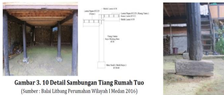
Gambar 3. 10 Detail Sambungan Tiang Rumah Tuo (Sumber : Balai Litbang Perumahan Wilayah I Medan 2016)

Material Tiang Pondasi: Struktur yang digunakan yakni jenis rumah panggung. Jenis pondasi yang digunakan yakni pondasi umpak dengan alas batu sendi. Batu sendi yang digunakan biasanya menggunakan material kayu atau beton cor.