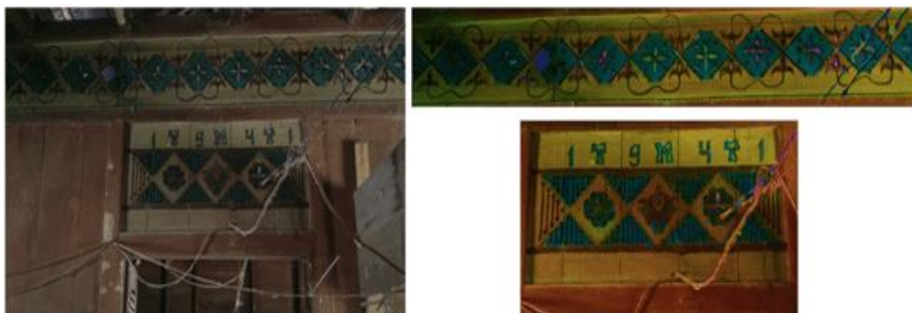
Gambar 8. Ornamen Bunga Keduduk di Rumah Tuo Pati Temat

Ruang-ruang pada Rumah Tuo memiliki hirarki sesuai dengan fungsinya. Ruang dengan fungsi tertinggi salah satunya yakni ruang tengah dan balai malintang. Balai Malintang merupakan ruang tempat duduk ninik, mamak, cadik, tuo tengganai dan alim ulama. Ruangan ini memiliki level tertinggi daripada ruang lainnya [12]. Ruang Tengah memiliki fungsi untuk berkumpul dan istirahat keluarga (Gambar 8).