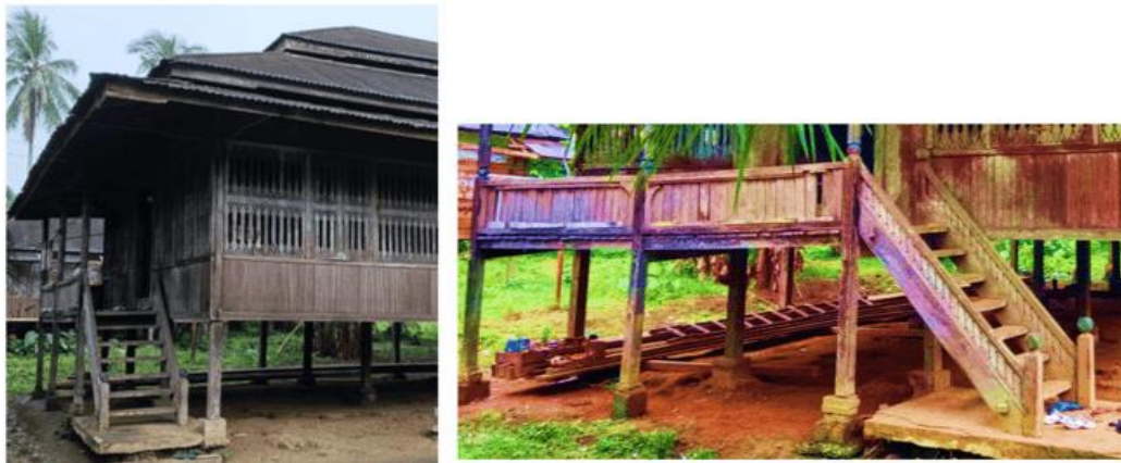
Gambar 9. Struktur Tiang Pondasi dan Tiang Rumah Tuo Pati Temat

Ornamen pada Rumah Tuo memiliki fungsi sebagai status sosial tinggi, sehingga kadangkala dibuat khusus [13] sesuai dengan Rumah Tuo dibangun dan dengan motif bunga keduduk. Pada Rumah Tuo Pati Temat yang merupakan kepala desa saat itu, dibuat khusus dengan 3 bunga utama dan tahun 1941 sebagai bentuk ornament. Masing-masing ornament yang terdapat pada Rumah Tuo diciptakan dan direkaya sesuai dengan peruntukan dan fungsi-fungsi pada ruang Rumah Tuo [14]. Hal ini tentunya membuat lebih banyak keberagaman dalam penggunaan ornamen sesuai dengan jenis flora dan fauna yang terdapat di lingkungan sekitarnya (Gambar 9).