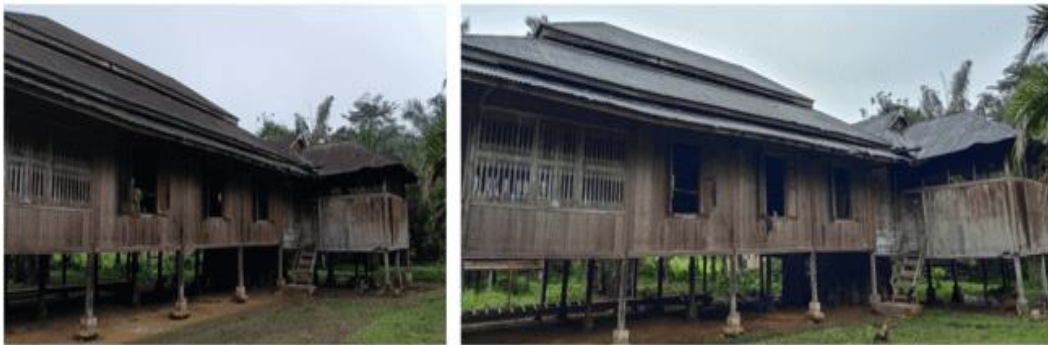
Gambar 5. Tampak Rumah Tuo Pati Temat

Rumah adat seringkali mengalami perubahan fungsi karena adanya perubahan aktivitas pengguna. Beberapa Rumah Tuo yang berada pada koridor Jalan Padang Lamo pada area lantai 1 digunakan untuk berbagai fungsi yakni toko sembako, garasi dan gudang. “ Umah deh umah pateli, umah belampit balembago, ka ateh batutup dengan bubung pirak, kabawah ba aleh badendi gading. Ka ateh batutup dengan bubung pirak itu yang dinamakan syarak, di bawah ba aleh basendi gading itu dinamakan adat, syarak mengato adat memakai ” [11]. Berdasarkan seloko adat Jambi ini dijelaskan makna dan fungsi rumah adat yang masih akan tetap sesuai dengan perubahan kehidupan (Gambar 5).