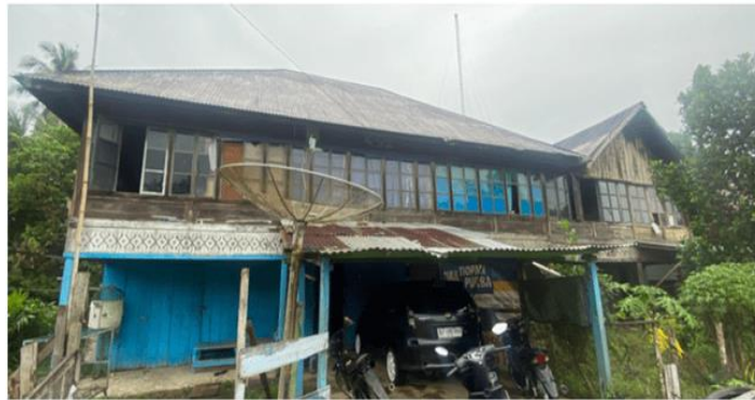
Gambar 4. Sampling Rumah Tuo dengan perubahan fungsi

Rumah adat seringkali mengalami perubahan fungsi karena adanya perubahan aktivitas pengguna. Beberapa Rumah Tuo yang berada pada koridor Jalan Padang Lamo pada area lantai 1 digunakan untuk berbagai fungsi yakni toko sembako, garasi dan gudang. “ Umah deh umah pateli, umah belampit balembago, ka ateh batutup dengan bubung pirak, kabawah ba aleh badendi gading. Ka ateh batutup dengan bubung pirak itu yang dinamakan syarak, di bawah ba aleh basendi gading itu dinamakan adat, syarak mengato adat memakai ” [11]. Berdasarkan seloko adat Jambi ini dijelaskan makna dan fungsi rumah adat yang masih akan tetap sesuai dengan perubahan kehidupan (Gambar 5).