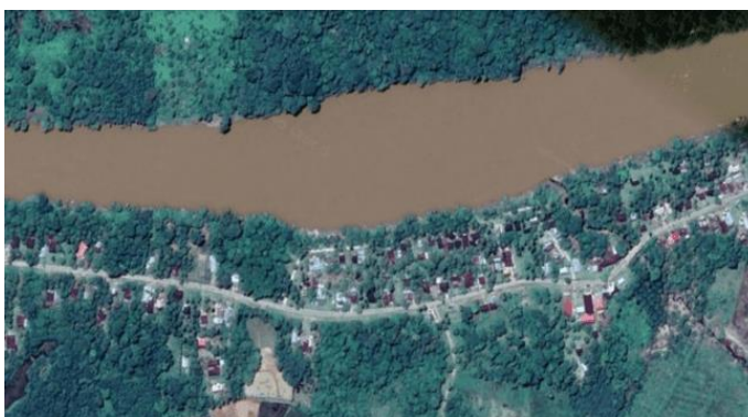
Gambar 1. Permukiman Koridor Jl. Padang Lamo, Sungai Abang

Sungai Abang merupakan ibu kota dari Kecamatan VII Koto yang terletak di Kabupaten Tebo, Provinsi Jambi, berada pada koordinat 1,18° hingga 1,35° Lintang Selatan dan 102,37° hingga 102,45° Bujur Timur, dengan luas wilayah 658,79 km 2 atau sekitar 10,20% dari total luas Kabupaten Tebo. Kecamatan ini berbatasan dengan Provinsi Riau di sebelah utara, Kecamatan VII Koto Ilir di timur, Kecamatan Rimbo Ulu dan Kabupaten Bungo di selatan, serta Provinsi Sumatera Barat di barat.