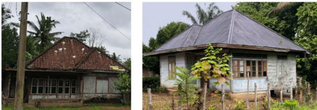
Gambar 2. Sampling Rumah Tuo tidak panggung

Pada sampling Rumah Tuo yang berada di Permukiman koridor jalan terdiri atas beberapa rumah yang di huni oleh masyarakat. Secara keseluruhan tipologi Rumah Tuo yang berada di permukiman ini memiliki pola linear (Gambar 2), hal ini dikarenakan sejak tahun 1940 mayoritas transportasi dan kegiatan berfokus pada aliran Sungai Batanghari.