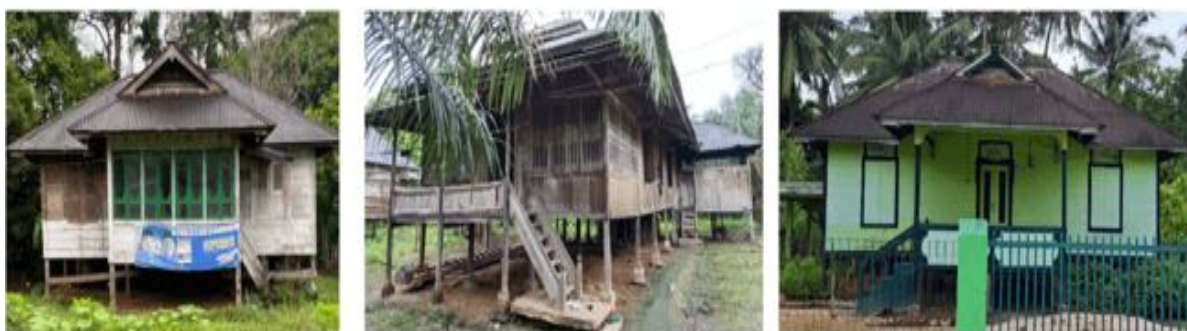
Gambar 3. Sampling Rumah Tuo Struktur panggung

Pada koridor Jalan Padang Lamo, terdapat beberapa bangunan Rumah Tuo yang tidak berjenis panggung (Gambar 3). Berdasarkan hasil wawancara yang dilakukan dengan penghuni, awalnya kedua rumah ini memiliki struktur panggung, akan tetapi seiring berjalannya waktu permukaan tanah naik dan menimbun Sebagian struktur pondasi dan tiang yang menumpu bangunan Rumah Tuo tersebut. Perubahan bentuk bangunan ini tentunya menghilangkan beberapa bagian penting yang memiliki makna simbolik kuat contohnya tangga.