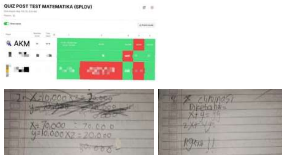
Gambar 1. Hasil Jawaban Subjek KTI

Berdasarkan hasil jawaban subjek pada gambar 1. menunjukkan bahwa subjek tidak dapat menuliskan informasi yang ada pada soal nomor 2. Subjek dapat menghitung dan menentukan jawaban akhir yaitu 50.000, meskipun tidak dapat menuliskan informasi yang ada pada soal. Sedangkan subjek pada soal nomor 4 dapat menuliskan informasi pada soal namun tidak lengkap. Subjek menuliskan x + y = 99 dan 2x + 4y = \dots , namun jawaban yang benar adalah x + y = 99 dan 2x + 4y = 266 . Sehingga subjek juga kesulitan dalam menghitung nilai akhir, subjek menuliskan 30.000 sedangkan yang benar adalah 232.000.