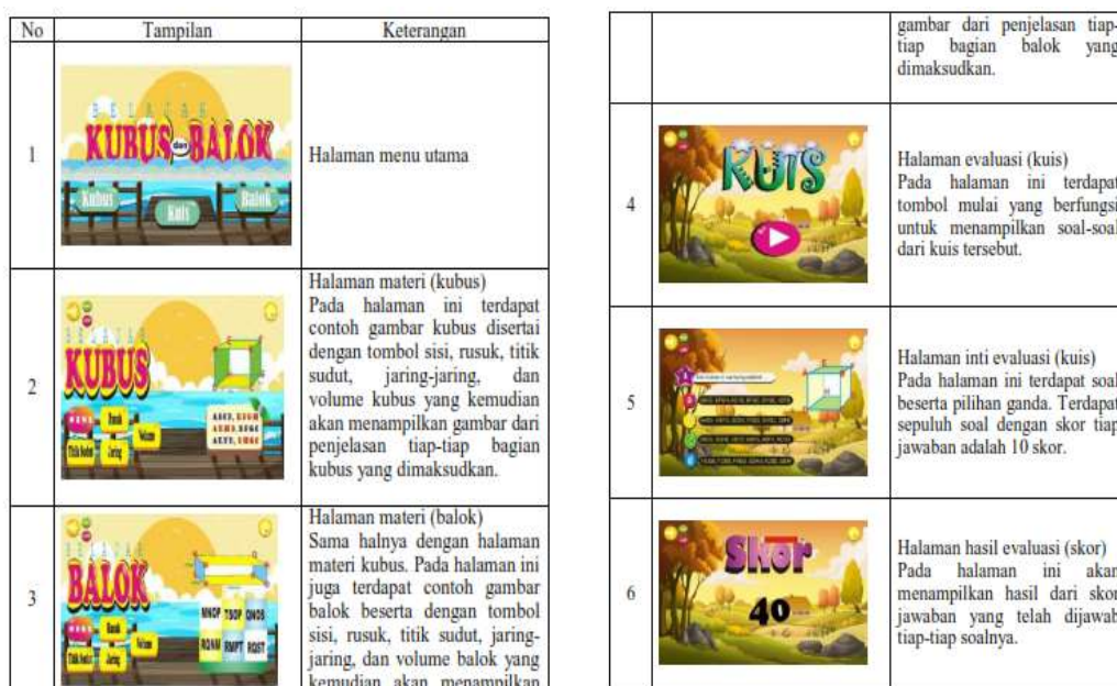
Tabel 2. Tampilan Media Pembelajaran

Hasil penelitian menunjukkan bahwa media pembelajaran matematika berbasis Adobe Flash yang dikembangkan dapat digunakan sebagai alternatif media interaktif di sekolah dasar. Media ini dinilai efektif karena mampu menggabungkan aspek visual, audio, animasi, serta interaktivitas yang memudahkan siswa dalam memahami konsep-konsep abstrak dalam matematika, khususnya pada materi operasi hitung dan geometri dasar.