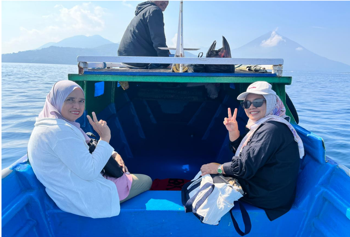
Gambar 1. Tim pengabdian kepada masyarakat menuju lokasi