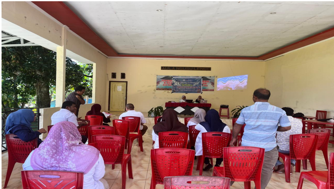
Gambar 5. Peserta kegiatan pengabdian kepada masyarakat