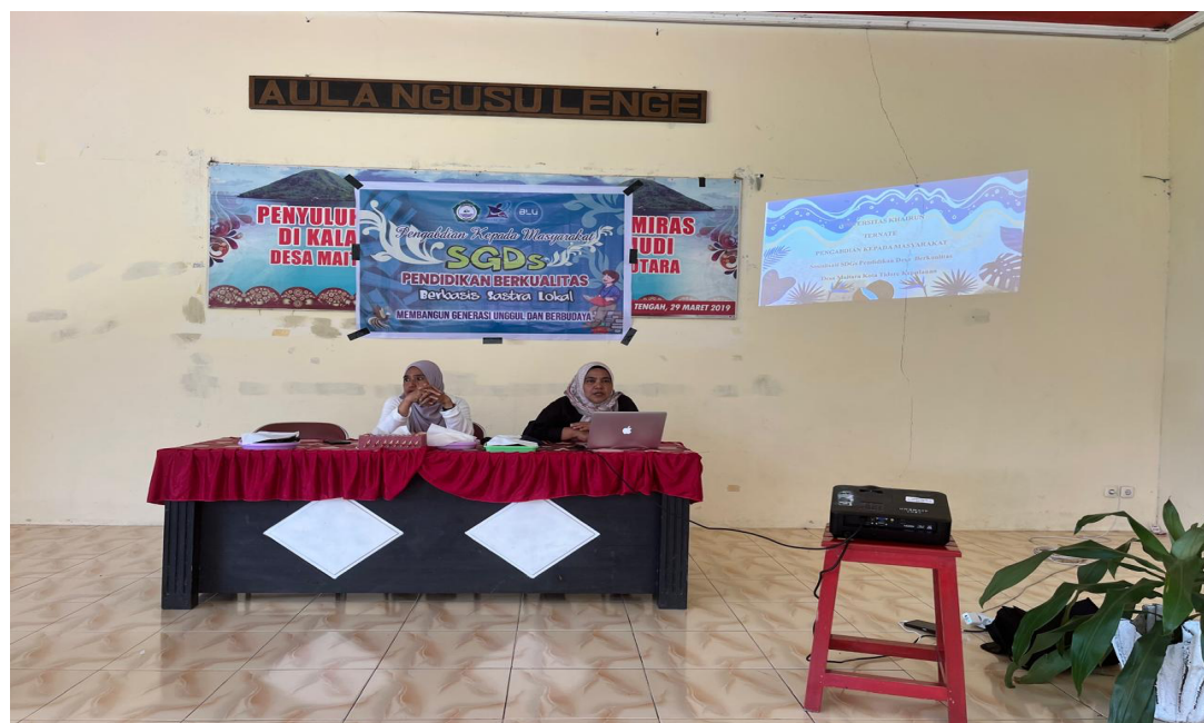
Gambar6. Penyajian materi sosialisasi SDGs Pendidikan Berkualitas Berbasis Sastra Lokal