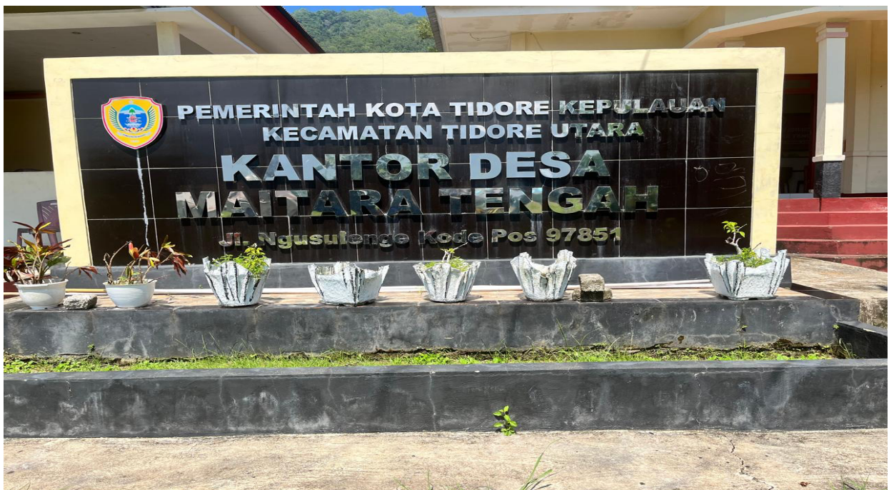
Gambar 2. Lokasi pelaksanaan pengabdian kepada masyarakat