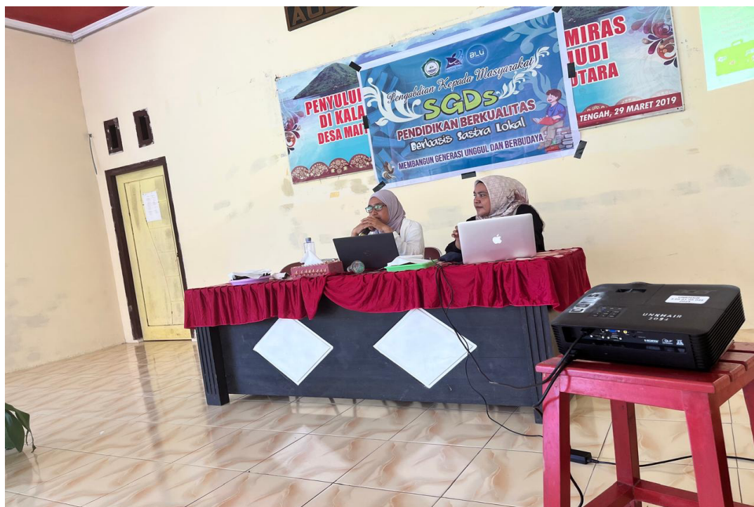
Gambar 4. Penyajian materi mengenai sosialisasi SDGs pendidikan berkualitas berbasis sastra lokal