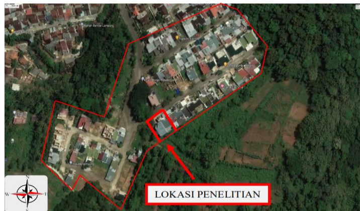
Gambar 3. Lokasi Penelitian

Penelitian dilaksanakan di Perumahan Imam Bonjol, Kecamatan Kemiling, Kota Bandar Lampung, yang merupakan kawasan permukiman dengan kepadatan sedang hingga tinggi serta infrastruktur drainase yang belum optimal. Waktu pelaksanaan penelitian berlangsung dari bulan Maret – Juni 2025.