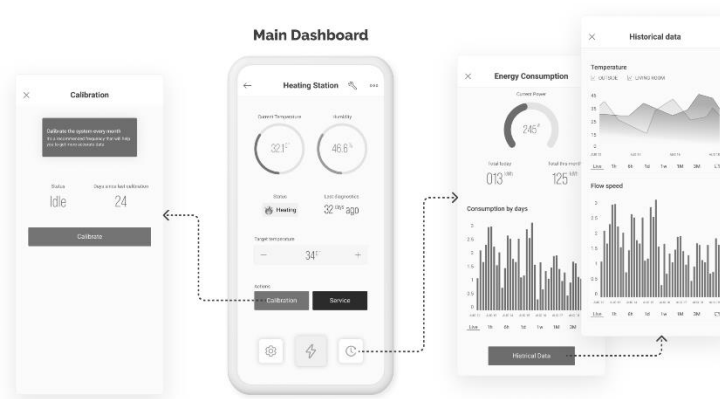
Gambar 2 Tampilan Aplikasi Blynk Server

Metode yang digunakan dalam penelitian ini bersifat eksperimen lapangan. Sistem dikembangkan menggunakan sensor ultrasonik untuk deteksi objek (hama), sinar ultraviolet (UV) sebagai pengusir hama di malam hari, serta mikrokontroler ESP32 sebagai pusat kendali data. Sistem terhubung dengan server Blynk yang memungkinkan pemantauan dan pengendalian secara real-time melalui perangkat mobile.