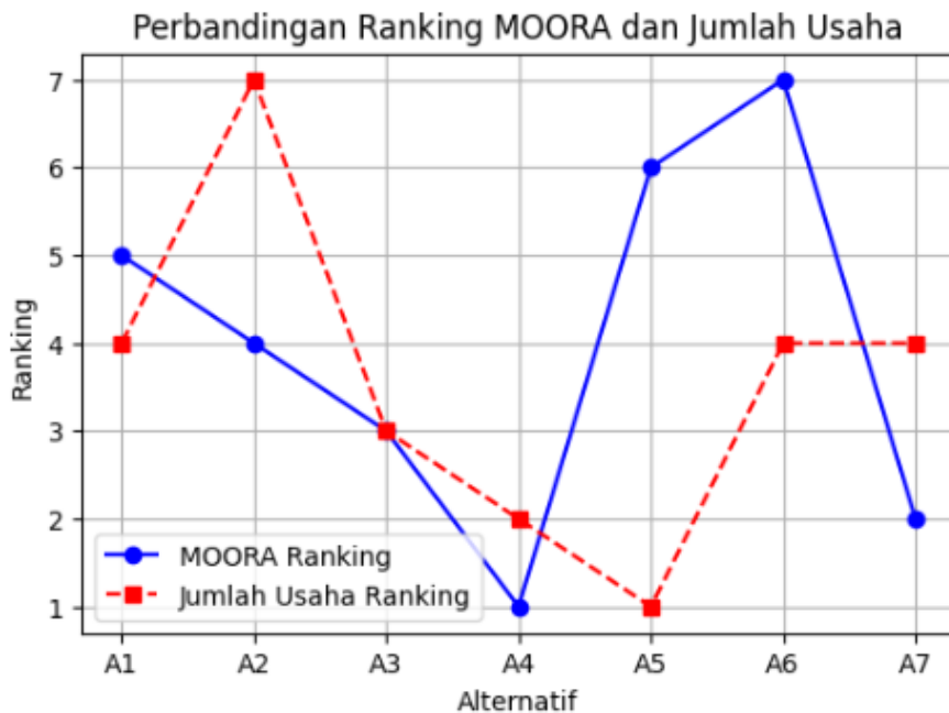
Gambar 2. Perbandingan Ranking MOORA dan Jumlah Usaha

dalam model MOORA, seperti produksi, luas lahan, tenaga kerja, dan biaya operasional, belum sepenuhnya mencerminkan distribusi perusahaan budidaya di lapangan.